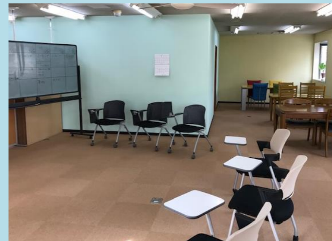
訓練・作業室（生活訓練）