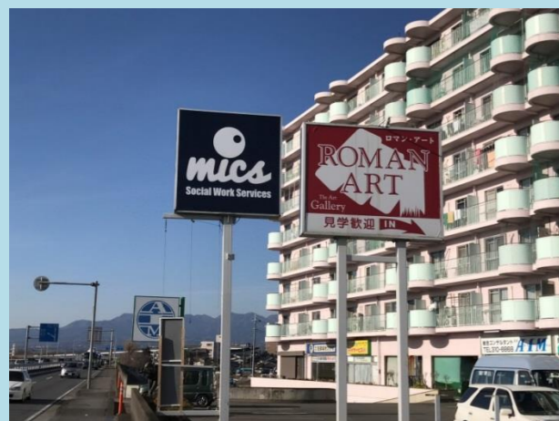
国道 17 号側（入口・駐車場）