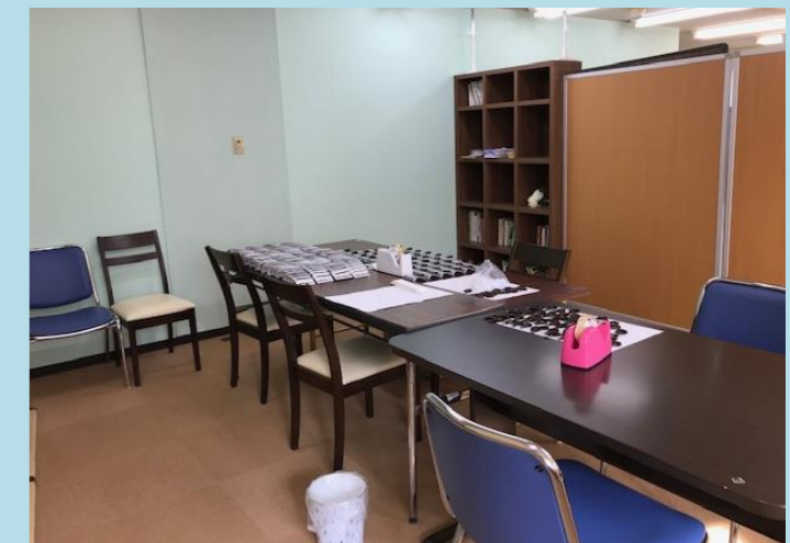
訓練・作業室（就労継続支援B型）

障害者総合支援法による自立訓練（生活訓練）と就労継続支援B型の事業を一体的に行う多機能型事業所です。精神障害、知的障害、身体障害や発達障害をお持ちの方で、生活能力の維持・向上などを目的とした訓練や、就労を目指した作業訓練を必要とする方を対象としています。